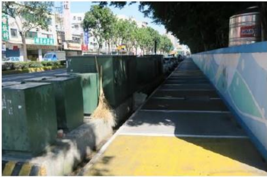
遷移原人行道上公共設施整併至路側停車帶