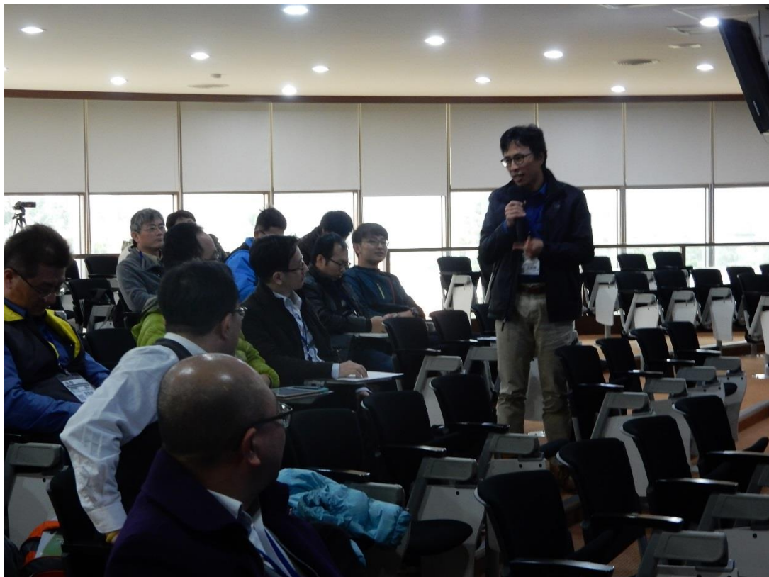
各縣市經驗交流-分享討論