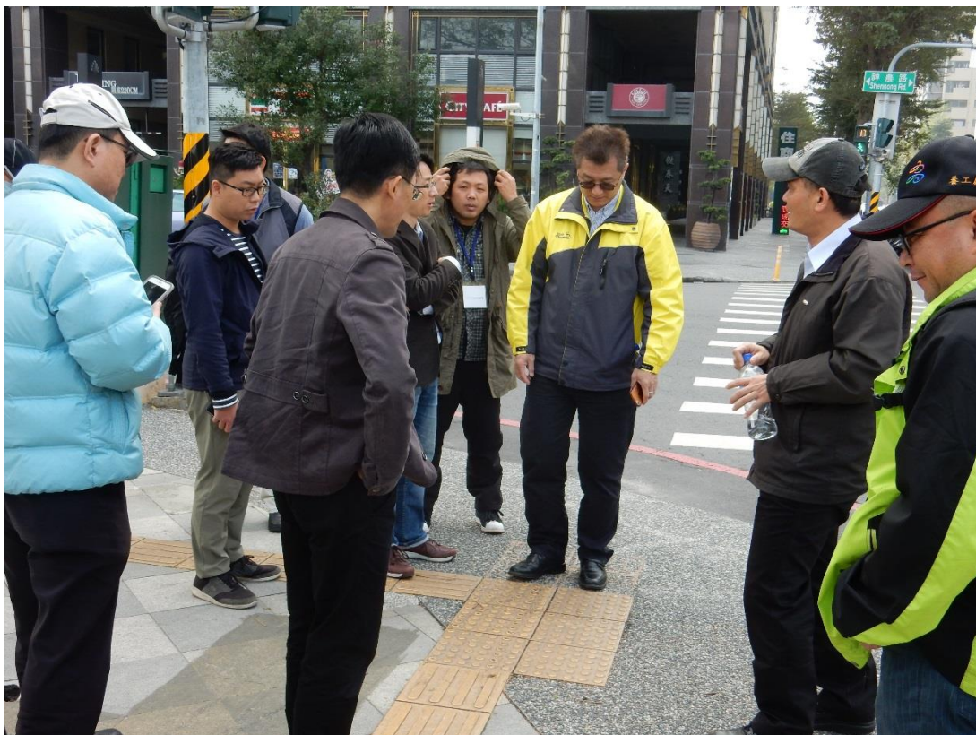
現場觀摩-高雄市凹子底公園警示帶