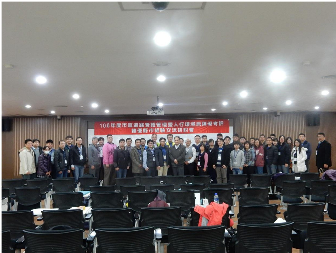
各縣市經驗交流-大合照